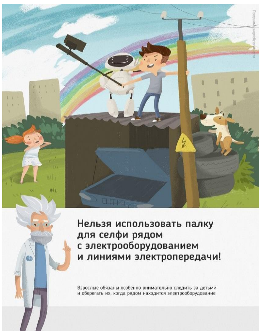
Рис 2. Нельзя использовать палку для селфи рядом с электрооборудованием и линиями электропередачи

Ну и, наконец, нужно повторить с ребенком алгоритм действий в экстремальной ситуации. Проверьте, умеет ли он набирать на сотовом телефоне телефон экстренных служб. Изучите с ним вещества и предметы, которые хорошо проводят электрический ток и потому особенно опасны, и, наоборот, вещества и предметы, плохо проводящие электрический ток и полезные в экстремальной ситуации.