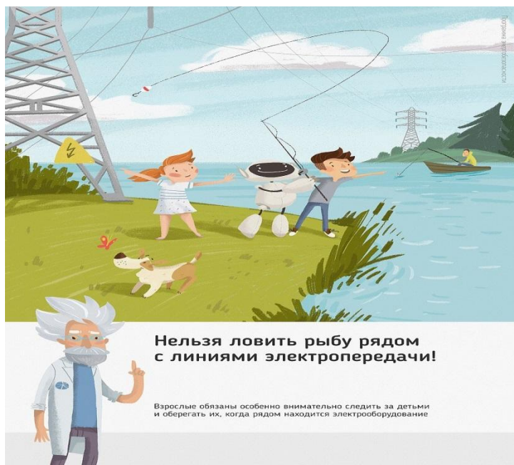
Рис. 4 Нельзя ловить рыбу рядом с линиями электропередачи

Об открытых подстанциях, оборванных проводах нужно сообщить в Кубанское ПМЭС по телефону 8-861-219-40-20 или позвонить на единый телефон всех экстренных служб 112.