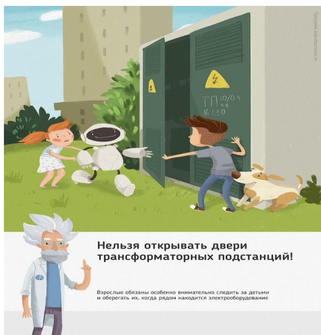
Рис.1 Нельзя открывать двери трансформаторных подстанций

Ежегодно энергетики проводят для школьников познавательные уроки, конкурсы рисунков и историй на тему электричества и правильного с ним обращения. Но работы одних энергетиков в данном направлении недостаточно, для полного понимания проблем электробезопасности нужен пример общества, в котором растет ребенок, и, конечно же, главным образом родителей. Эта работа приносит свои результаты: электротравмы на энергетических объектах единичные, и каждый случай становится поводом для служебной проверки. Но только технических мер мало для того, чтобы полностью обезопасить детей. Им нужен пример родителей.