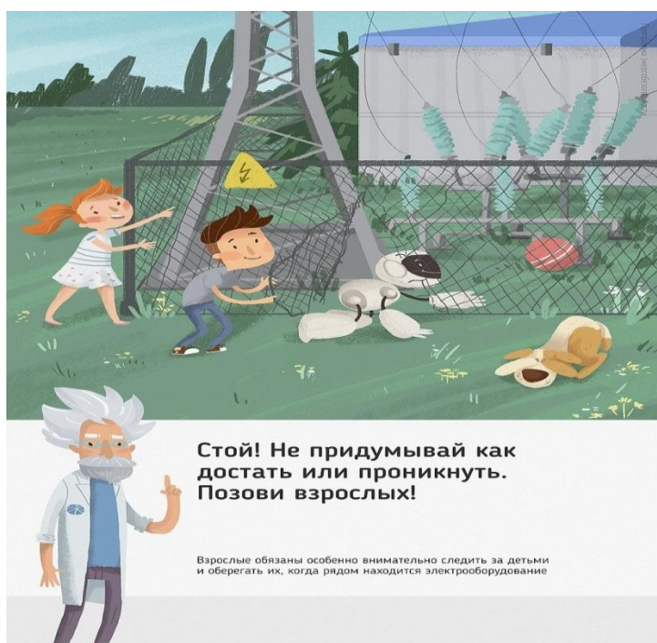
Рис. 5 Стой! Не придумывай как достать или проникнуть. Позови взрослых!