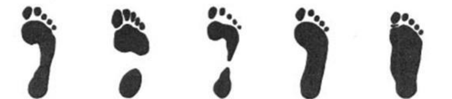
Нормальная стопа Стопа с высоким сводом (полая стопа) Гиперпроницированная (валгусная) стопа Уплющенная стопа Плоско-валгусная стопа

Факторы, влияющие на развитие плоскостопия: